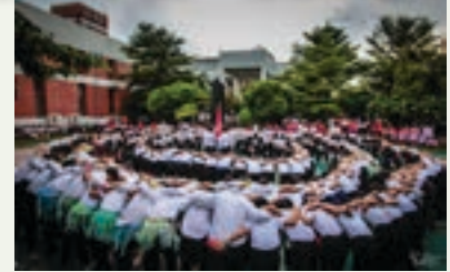
รางวัลรองชนะเลิศ อันดับ 2