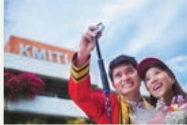
รางวัลรองชนะเลิศ อันดับ 1