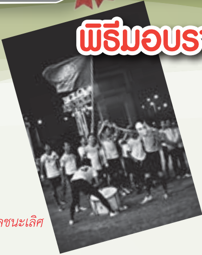
รางวัลชนะเลิศ