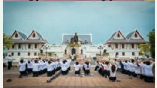
รางวัลชมเชย (3 รางวัล)